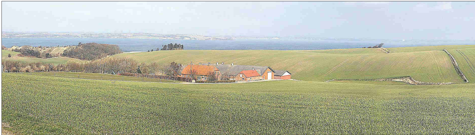
Mosebjerg er igen i spil i forbindelse med molergravning på Mors.