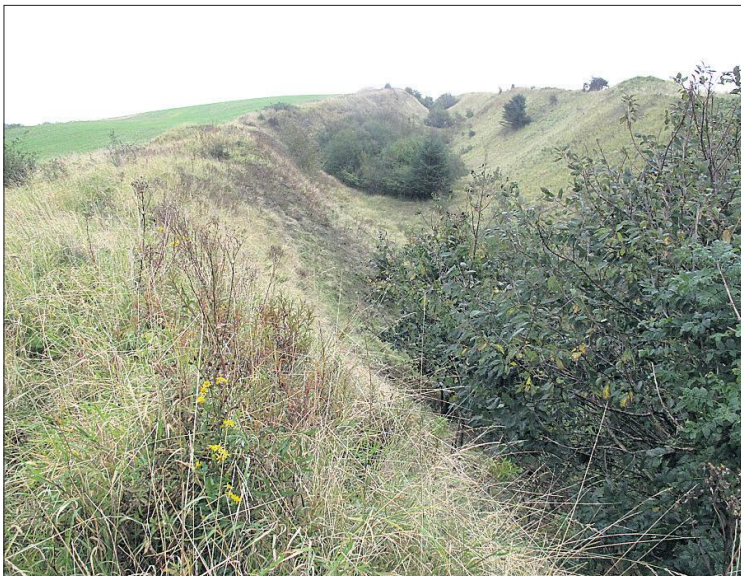
Overdrevet alias den gamle grav fra dengang molerindvinding foregik mod små maskiner og skovle. Nu skal den efterlades i fred.

- Det ligger fast, at der, hvor dispensationen er ophævet, kan der efter loven ikke foregå råstofindvinding. Vi vil nu afvente et udspil fra ansøger om, hvad virksomheden tænker om den nye situation. Der skal under alle omstændigheder ske en projektilpasning. Det